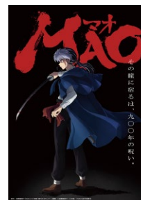
原作/高橋留美子「MAO」(小学館「週刊少年サンデー」連載) ©高橋留美子/小学館/「MAO」製作委員会