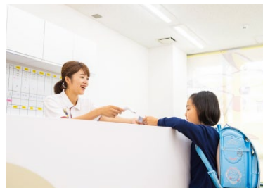
ポケモングローバルアカデミーたまブラーザ