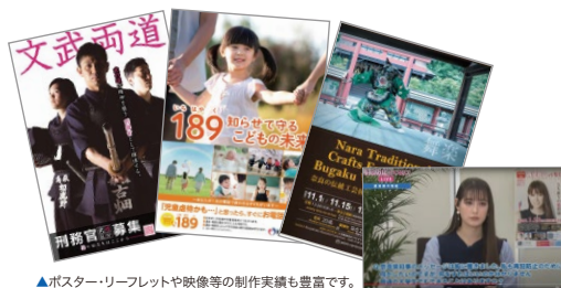
▲ポスター・リーフレットや映像等の制作実績も豊富です。