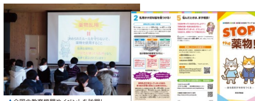
▲全国の教育機関やイベントを訪問し、薬物乱用防止へ向けた各種取り組みを行っています。