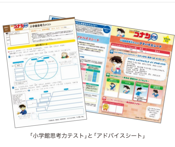
「小学館思考力テスト」と「アドバイスシート」