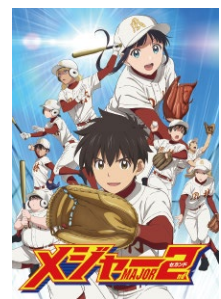
メジャーセカンド