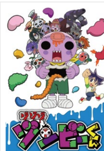
ゾンゾ ゾンビーくん

©ShoPro/ Spin Master Ltd. ©ながとしやすなり/ 小学館