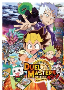
デュエル・マスターズキング

TM and ©2020, Wizards of the Coast, Shogakukan, Mitsui/Kids, ShoPro, TV TOKYO