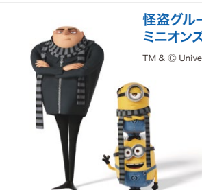
怪盗グルーシリーズ ミニオンズ