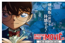
▲DETECTIVE CONAN THE MOVIE 展 ～銀幕の回顧録(メモワール)～