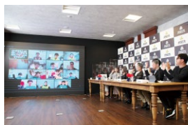
▲全国小学生プログラミング大会「ゼロワン グランドスラム」決勝大会(オンライン実施)