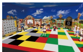
▲ShoPro VR おはスタ&ガル学。バーチャルスタジオ