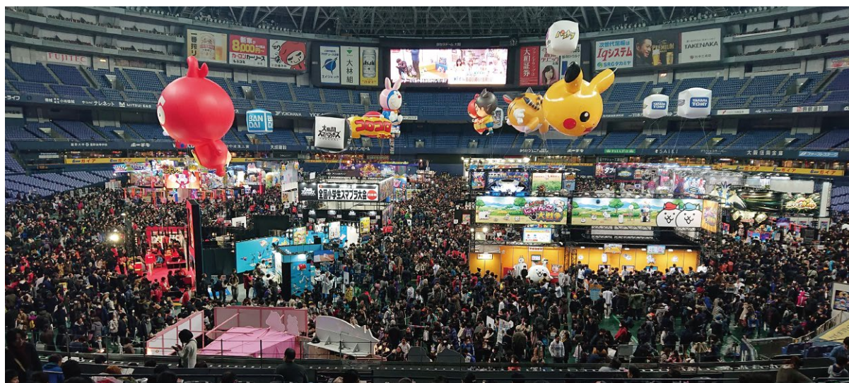
▲次世代ワールドホビーフェア