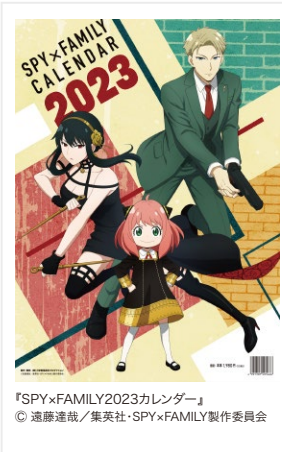
『SPYxFAMILY2023カレンダー』 © 遠藤達哉/集英社・SPYxFAMILY製作委員会