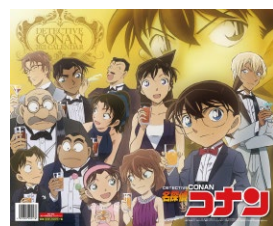
『コナンカレンダー 2021』 ©青山剛昌 / 小学館・読売テレビ・TMS 1996