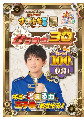
『ひらめき王子松丸くんのひらめけ!』 ナゾトキ学習5 ひらめき30 ©ShoPro・TV TOKYO ©RIDDLER,inc.