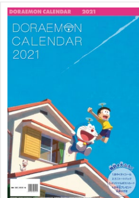
『ドラえもんカレンダー 2021』 ©藤子プロ・小学館・テレビ朝日・シンエイ・ADK