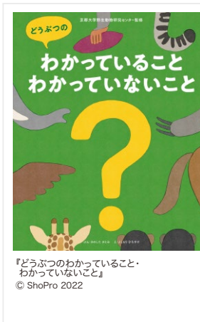
『どうぶつのわかっていないこと』 © ShoPro 2022