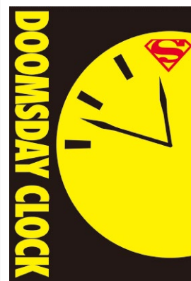
『ドゥームズデイ・クロック』 TM&©2020 DC. All Rights Reserved.