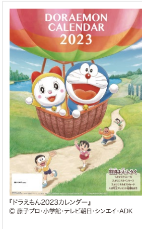
『ドラえもん2023カレンダー』 © 藤子プロ・小学館・テレビ朝日・シンエイ・ADK