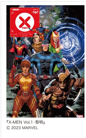
『X-MEN Vol.1：黎明』 © 2023 MARVEL