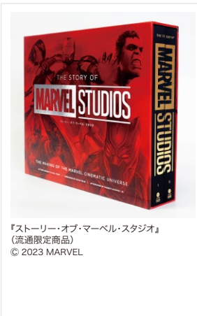
『ストーリー・オブ・マーベル・スタジオ』 (流通限定商品) © 2023 MARVEL