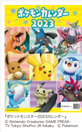
『ポケットモンスター2023カレンダー』 © Nintendo・Creatures・GAME FREAK・ TV Tokyo・ShoPro・JR Kikaku © Pokémon