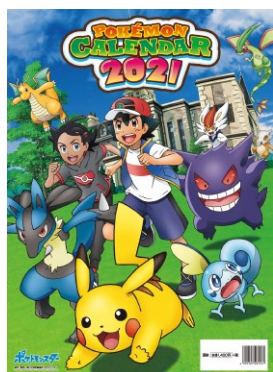
『ポケモンカレンダー 2021』